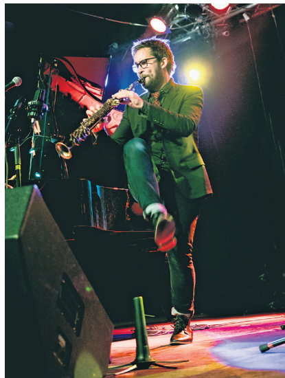
Емил Паризијен

Матијасом Свенсоном, и аустријским гудачким квартетом изводио је обраде шведских, руских и мађарских народних песама – препознајући неке теме, публика их је дочекала радосним одобравањем.